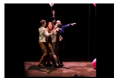
LES BELLES DE NUIT de Magali Mougel

« La pièce démarre à cent à l'heure, et très vite le public oscille entre rires et émotion. Trois comédiennes, trois visages différents, portent en elles la fragilité, l'insolence et la souffrance de cette mère devenue héroïne de traédie malgré elle. »