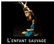
L'ENFANT SAUVAGE de Bruno Castan

«Le spectacle capte l'attention du jeune spectateur sur des notions aussi complexes que l'absence, le trou noir, la peur, la séparation grâce à des gestes doux et tendres, de vieilles valises rassurantes, des flacons de parfum embaumants et toujours les frémissements cocasses du Chien. C'est tout simplement lumineux.»