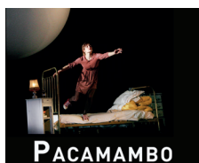
PACAMAMBO de Wajdi Mouawad